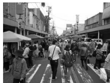
新津あおぞら市場