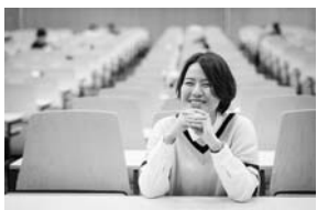
信頼されるプロになる。