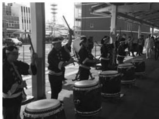
昨年の歓迎セレモニーの様子

今回の変更により、利用者への影響が懸念されますが、発祥の地である新津駅としては素直に歓迎したいところです。また、地域のおもてなし力を一層磨くほか、駅周辺からまちなかの整備に繋がられるような様々なアイ