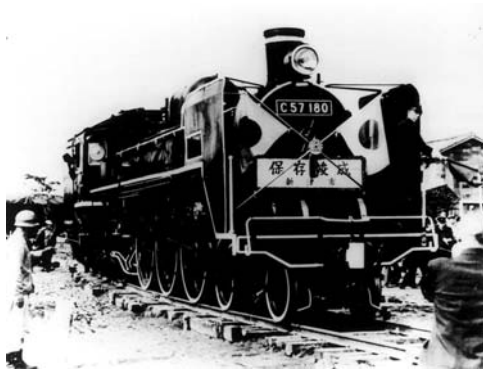
1969年磐越西線の引込線から新津第一小学校へ

JR東日本の「SLばんえつ物語」号(以下「ばんえつ号」)の発着駅が、今春より新潟駅から新津駅に変更となります。 30年間静態保存のばんえつ号は、現役引退後、新津第一小学校に30年間手厚く保存されていたC57形180号機を、国鉄OBの皆さんらが中心となって運転を復活させたという胸躍る物語を持つ、鉄道のまちとしての宝です。