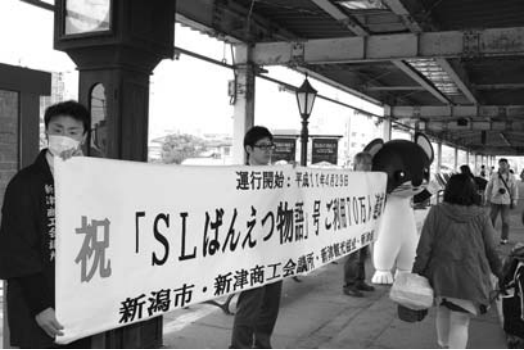
2013年新津駅でのばんえつ号乗車70万人達成イベント