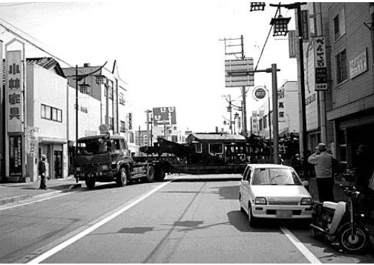
1998年トレーラーによりけん引される解体された運転室