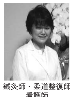
鍼灸師・柔道整復師 看護師

保険は扱っており、初診料金1,000円に加え施術料金は一般の方4,000円、65歳以上シルバー様は3,000円ですが、今回の会報誌をご覧の方には初診料金1,000円を割り引きさせていただきます。