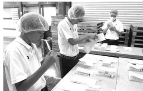
新津工業高校インターンシップの様子

当所は毎年、区内の高等学校や中学校からのインターンシップ(就業体験活動)を積極的に受け入れています。 本年度は7月25日(月)~27日(水)の3日間、新津工業高等学校からのインターンシップを受け入れました。 同校からのインターンシップは7年連続しての受け入れとなりますが、1日目は商工会議所業務の研修と会員事業所の訪問、2日目はまちの駅ぽぽでの実習と会員事業所の訪問、3日目は観光協会業務等の研修を行いました。 当所の業務は多岐にわたりますので、3人の生