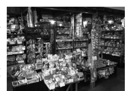
▲300種類以上の駄菓子やおもちゃがズラリ