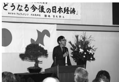
講演をする経済ジャーナリストの田嶋智太郎氏