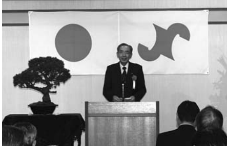
挨拶をする古川会頭