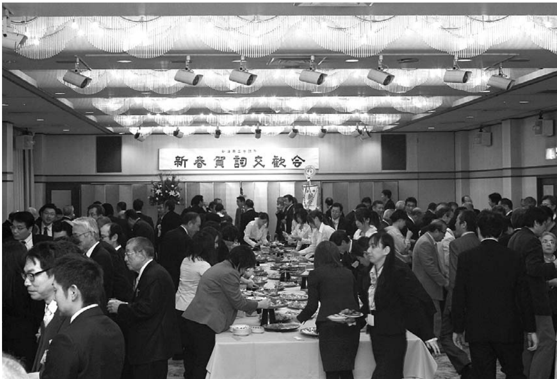
新春賀詞交歓会の様子