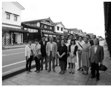
牧之通りにて参加者の皆様と記念撮影

当所では今後も役立つ視察研修会を企画して参りますので、大勢の会員の皆様のご参加をお待ちしております。