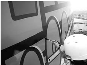
▲高所作業車を使って描画施工中

県内外からの行楽客など、年間300万台を超える高速度道路の利用者へ「鉄道の街にいつ」