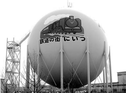
▲SLを描画したガスタンク

4月末「鉄道の街にいつ」をPRする目玉事業として越後天然ガス(株)様の北上ガスタンクにSLのイラストが完成しました。