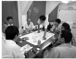
▲ワークショップの開催(7月)