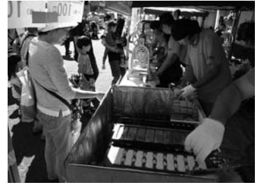
▲新津あおぞら市場、阿賀野川フェスティバル他にて新津名物「しごなな焼」販売(8~9月)

お問い合わせ／新津商工会議所青年部事務局 TEL:0250-22-0121 E-mail:n-yeg@fsinet.or.jp