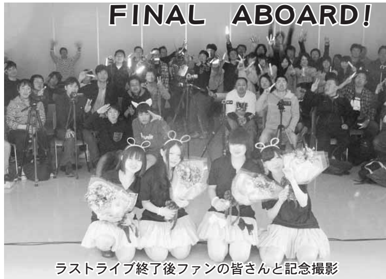
ラストライブ終了後ファンの皆さんと記念撮影

去る4月21日(日)、新津地域交流センターにて青年部プロデュース「秋葉区鉄道系アイドルユニットSLC 57」のラストライブが開催されました。ライブではオリジナル曲「ALL ABOARD」やカバー曲「MC D」や「カバール」を挟みながら約1時間行われ、多くの方々にお越し頂き盛況裡に終える事が出来ました。