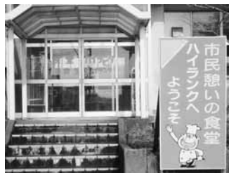
名前も気になる「ハイランク」

皆さんこんにちは。秋葉区役所に併設されたハイランク食堂です。区役所の職員食堂と思われがちですが、外の看板の通り「市民憩いの食堂」としてどなたでも入る事が出来ます。メニューもラーメン、うどん、そば、カレーなど定番メニューの種類も豊富にございますし、トレーいっぱいに乗ったおかずや小鉢がついた日替わり定食は400円と大変お得となっております。