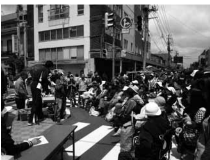
▲商店街オークションの様子

次回(10月7日)に開催予定です。詳しい内容等が決まり次第、HPや紙面等でお知らせいたしますので、どうぞご期待ください。出店募集は開催日時が正式に決定次第開始いたします。