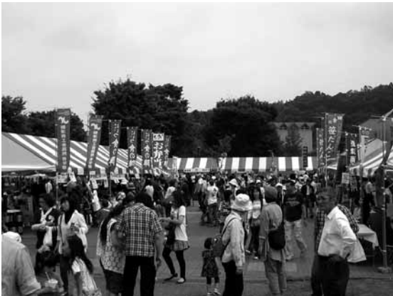
昨年の当日座の様子

経済活性化委員会の食事業プロジェクトが食を通じた地域の活性化を目的に実施しています。当所ではこれからも様々な事業を展開してまいりますので、引き続きよろしくお願いいたします。