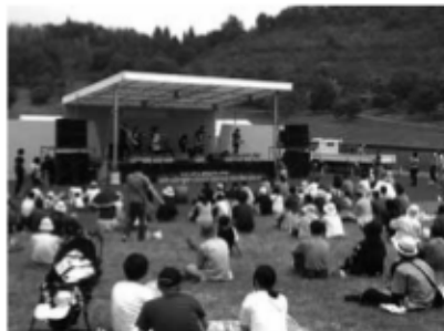
にいつ花ふるフェスタ