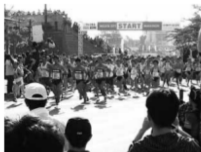
新潟シティマラソン

新潟市秋葉区川口乙578-40 http://www.ar-bic.co.jp/ TEL: 0250-22-4141 FAX: 0250-22-3440