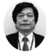
羽生 隆夫 (新潟市秋葉区長)