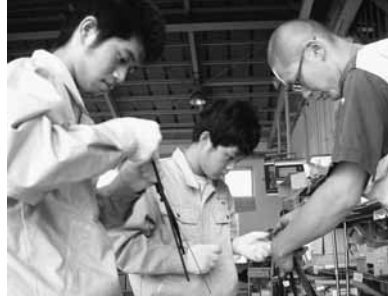
当所会員事業所でのインターンシップ

はまちの駅ぼっば、昭和基地一丁目C57の職場体験と当所会員事業所への実地体験を行いました。最終日は当所が企画するFM新津の番組「にいつホットステーション」に出演してもらい、3日間の感想と将来の夢を語っていただきました。