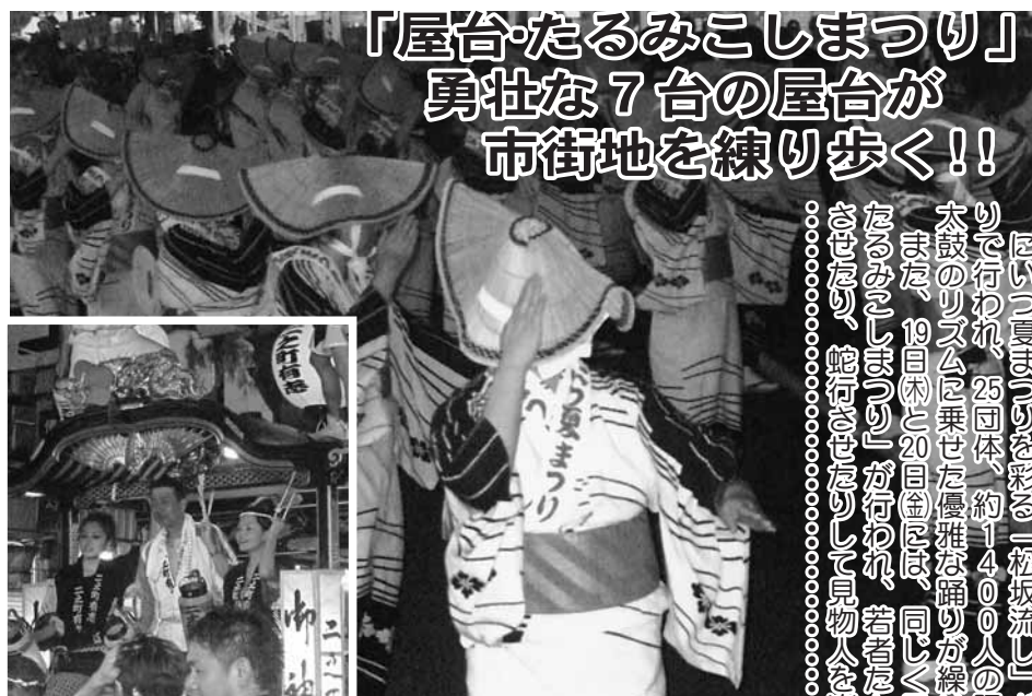
「屋台・たるみこしまつり」勇壮な7台の屋台が市街地を練り歩く!!