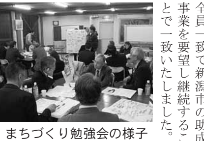
まちづくり勉強会の様子

「今後の活動の可能性がある」ということを明らかにし、参加者を4グループに分けて自己紹介をした後から勉強会を始めました。