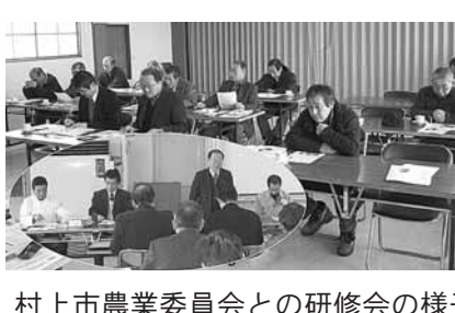
村上市農業委員会との研修会の様子

「今後の活動の可能性がある」ということを明らかにし、参加者を4グループに分けて自己紹介をした後から勉強会を始めました。