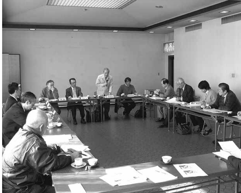
JAPANブランド委員会の様子

去る、2月22日(月)14:00から一楽ホールで、JAPANブランド育成支援事業委員会が開催されました。