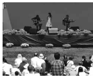
昨年の花ふるフェスタの様子

当日は新津駅西口・秋葉区役所・花ふる会場・石油の里を結ぶ無料のシャトルバスが運行されますので是非ご利用下さい。(9:30〜16:00)