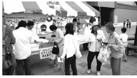
「はいつ鉄道まつり」の試作品ブースの様子

「地域食とものづくり総合展2008(東京ビッグサイト)」にも試作品の展示を予定しています。