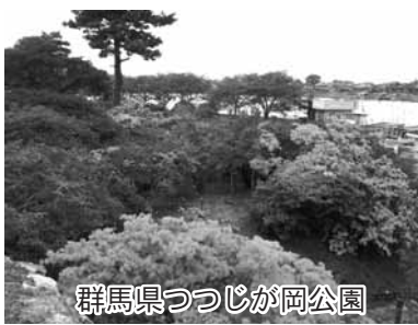
群馬県つつじが岡公園

今回は、新メンバーを迎え次の二つのことについて協議しました。 1. 地域食材(プチヴェール)を使った新商品の開発について、早急に新商品開発に着手して頂き、協議会で支援して行くこと