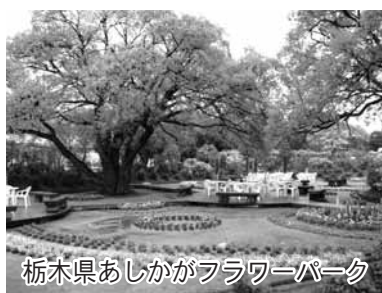
栃木県あしががフラワーパーク