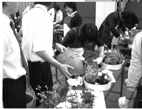
▼ガーデニング教室の様子