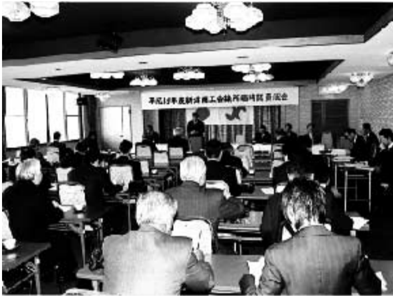
臨時議員総会の様子

発行所 新潟商工会議所 〒956-0864 新潟県新潟市秋葉区新津本町3丁目 番 号 TEL 0250(22)0121 FAX 0250(25)2332 Email: n-cci@fsinet.or.jp URL http://www.niitsu.or.jp/ 編集発行人 里村 進 毎月1回発行