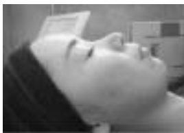
癒されながら美しくなりたい方におすすめ。肌本来の艶やかさを取り戻し、美しく潤った肌へと導きます。